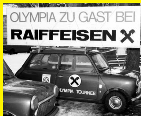
Das Giebelkreuz auf der 1976er-Fahrzeugflotte

Drittens , liegt auch uns die Jugend besonders am Herzen. Mit unserer gesamten Organisation und dem Raiffeisen Club Tirol mit seinen 90.000 jugendlichen Mitgliedern haben wir großartige Möglichkeiten, die Jugend, aber auch die Jugendspiele zu fördern und sehr viel Positives zu bewegen. Unser Engagement geht – so wie schon 1976 – weit über eine rein finanzielle Unterstützung hinaus. Die Rückkehr der Ringe kann für Tirol ein großer Erfolg werden, davon bin ich überzeugt. ✕