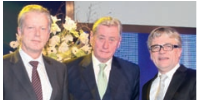
Bundesminister Reinhold Mitterlehner, Industrieller Hannes Androsch, voestalpine-Chef Wolfgang Eder