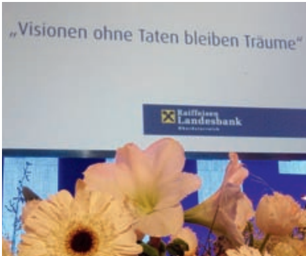
Die Raiffeisenlandesbank OÖ lässt Visionen Taten folgen.

auf ausreichend Liquidität achten. Die Raiffeisenlandesbank OÖ ist mit 3,3 Milliarden Euro Liquiditätsreserven in das Jahr 2010 gegangen.