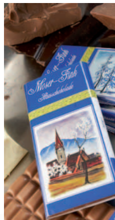
Schokogenuss in Tafelform