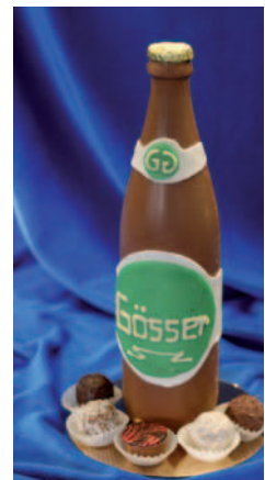
Gösser Bier einmal anders