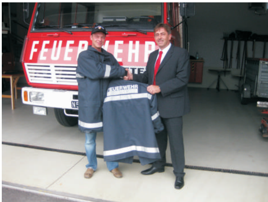
Die FF Neusiedl/Zaya schaffte neue Schutzjacken an.

Die Raiffeisen-Sparwoche findet heuer vom 27. bis 31. Oktober statt.