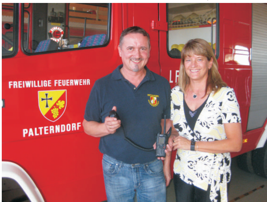
Die FF Palterndorf kaufte ein Digitalfunkgerät.

Für die kleinen Sparer gibt es selbstverständlich auch wieder ein Geschenk.