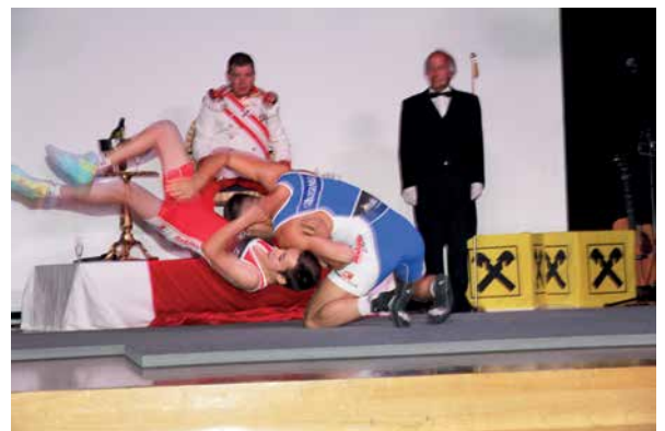
Der Kraftsportklub Klaus zeigt sein Können auf der Bühne.