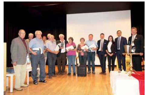
Verleihung der Ehrenmitgliedschaft an unsere langjährigen Mitglieder und Kunden

wir unseren Kunden Danke sagen! Denn sie ermöglichen es uns als Regionalbank, das zu tun, wofür wir hier sind: mitzuhelfen, dass es dem Vorderland und den hier lebenden Menschen gut geht.“