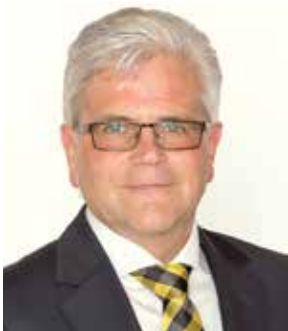
Dir. Bernhard Inwinkl Vorstand