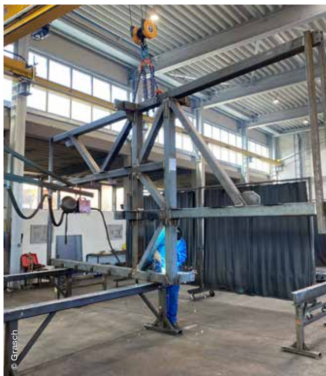
Das Stahlbauunternehmen aus Neudorf ob Wildon punktet bei seinen Kunden mit langjährigem Know-how.