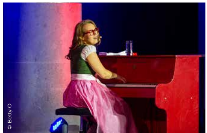
Schloss Gamlitz diente als Bühne für ein tolles Open Air.