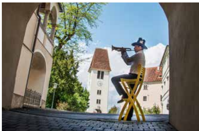
Tief reichen die Wurzeln der Raiffeisenbank in Leibnitz.

Der persönliche Kontakt ist Grundstein für einen vertrauensvollen Umgang miteinander. Dieser wiederum ist Basis für die Absicherung aller Kundeneinlagen bei der Raiffeisenbank Leibnitz. Mit Augenmaß, Weitblick und Hausverstand agiert und reagiert das Führungsteam des Hauses auf Veränderungen und Novitäten auf den Märkten.