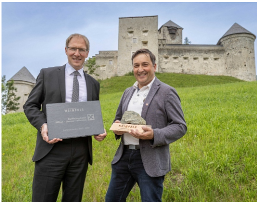
Premiumpartnerschaft Museumsverein Burg Heinfels