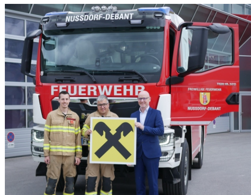
Freiwillige Feuerwehr Nußdorf-Debant