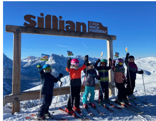
Schitag der Volksschule Heinfels