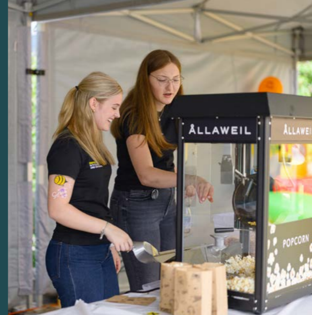
Frisch duftendes Popcorn gehört zu einem Fest dazu.

Ein besonderes Highlight war das umfangreiche Kinderprogramm. Beim Kinderschminken und Airbrush entstanden kreative Kunstwerke, die Kinderaugen strahlen ließen. Für Begeisterung sorgten außerdem unsere Sumsi, die große Hüpfburg, die Foto-box sowie das Glücksrad mit tollen Gewinnen. So wurde den kleinen Gästen den ganzen Tag über abwechslungsreiche Unterhaltung geboten.