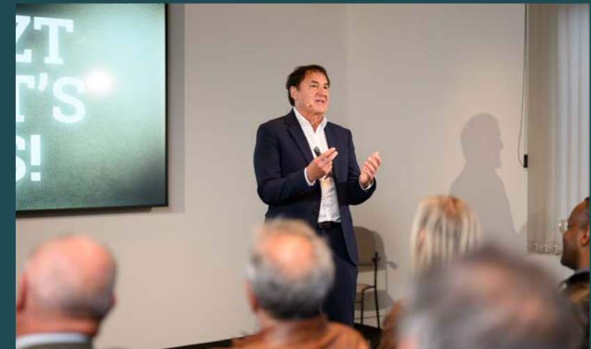
Österreichs Humorexperte Nummer eins beim Vortrag.