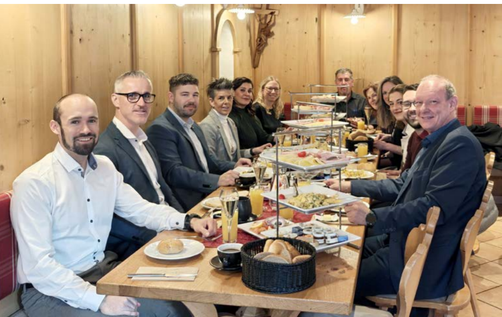
Der Vorstand lud die Jubilar:innen zu einem gemeinsamen Frühstück ein.