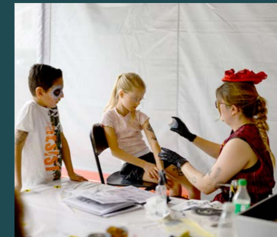
Großer Andrang beim Kinderschminken und Airbrush.

Der Tag der offenen Tür war nicht nur eine Gelegenheit, unsere neuen Räumlichkeiten zu präsentieren, sondern vor allem ein schönes Zeichen für Gemeinschaft, Begegnung und Zusammenhalt. Die vielen positiven Rückmeldungen und die großartige Stimmung machten diesen Tag zu etwas ganz Besonderem. Wir bedanken uns herzlich bei allen Gästen für ihren Besuch und freuen uns darauf, viele Kundinnen und Kunden auch künftig in unserer neuen Bankzentrale begrüßen zu dürfen.