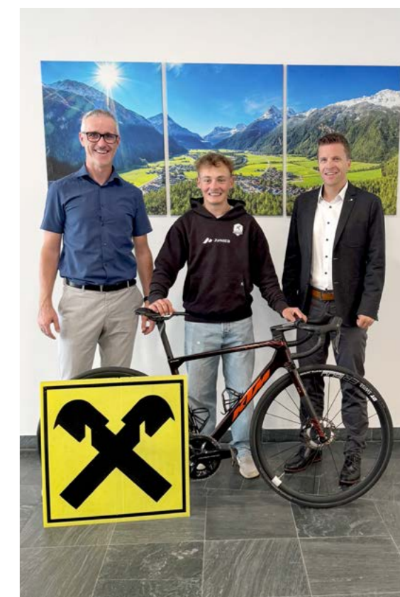
Rückenwind dank Unterstützung von Raiffeisen.