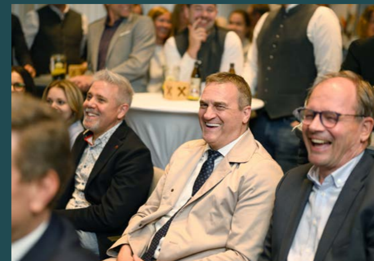
Die Keynote über die wichtige Rolle von Humor im Leben und am Arbeitsplatz sorgte für viele herzliche Lacher und Aha-Momente.