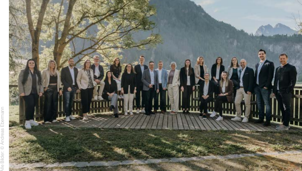
Das Team des Raiffeisen-Service-Centers Ötztal

Gerade in einer genossenschaftlichen Bankstruktur trägt ein Service-Center wesentlich dazu bei, wirtschaftlich nachhaltig zu handeln und gleichzeitig die regionale Nähe zu bewahren.