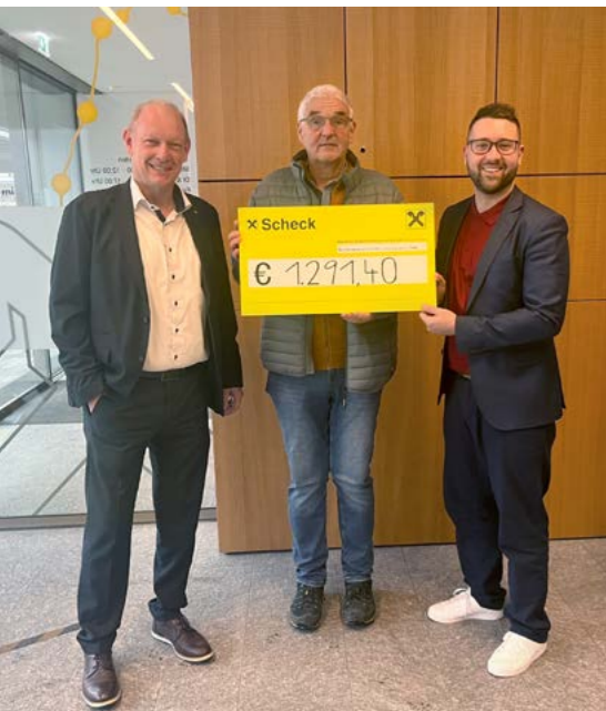
Die gesamten Spenden für Kaffee & Kuchen gehen an die St. Vinzenz-Gemeinschaft.