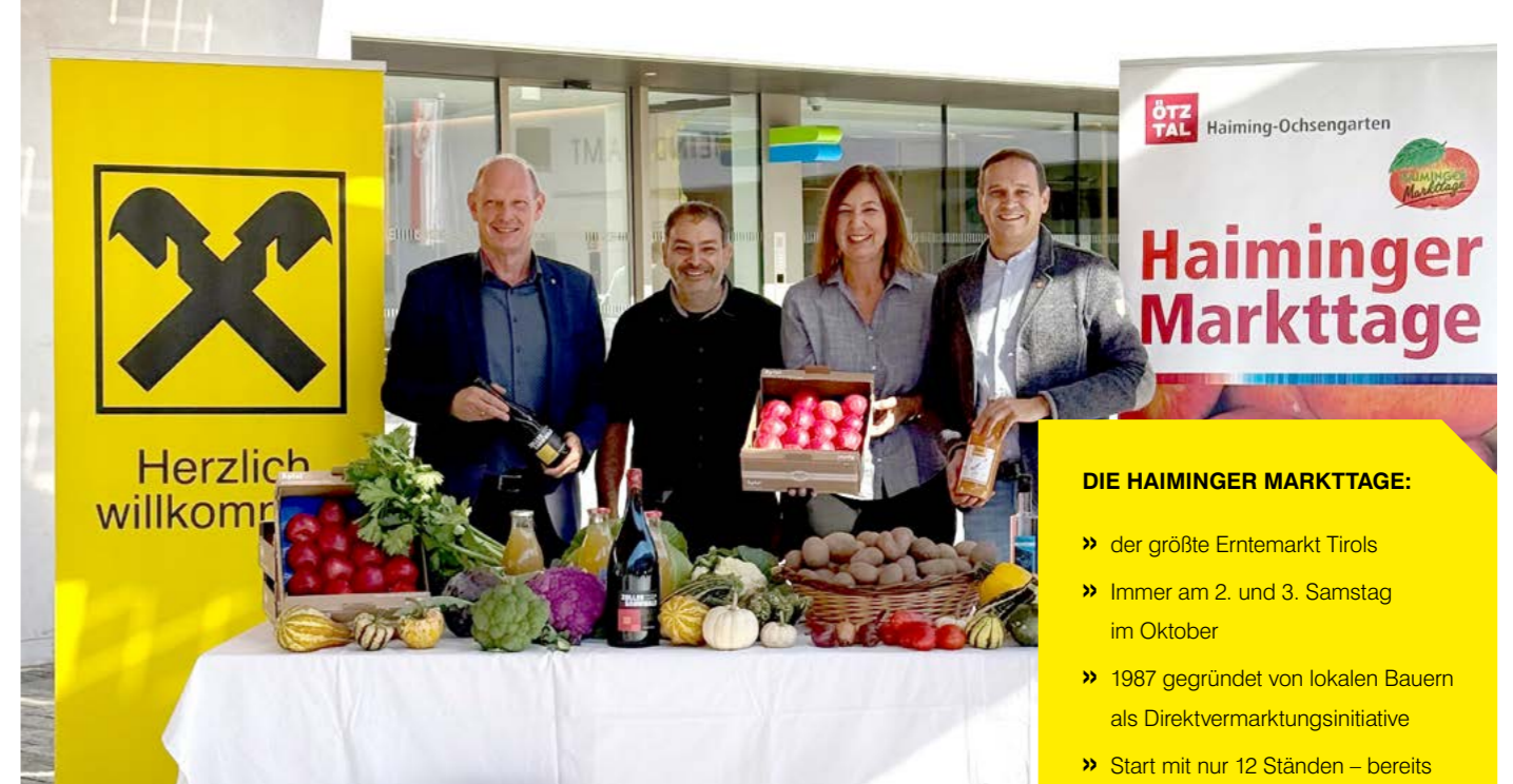
Raiffeisen unterstützt die Haiminger Markttage seit den Anfangstagen.

An vielen Ständen türmen sich Äpfel in allen Farben und Sorten. Kein Wunder: Haiming gilt als eine der wichtigsten Obstbaugemeinden Nordtirols. Der Apfel ist hier nicht nur Produkt, sondern Identität. Ob als frischer Tafelapfel, als Saft, Most, Schnaps oder verarbeitet in Kuchen und Strudel – er ist allgegenwärtig. Daneben finden sich auch kreative Spezialitäten wie Apfelbier, Edelbrände, ungewöhnliche Marmeladen oder neu interpretierte bäuerliche Rezepte. Besonders spannend: Hier kauft man direkt bei den Menschen, die die Produkte hergestellt haben. Diese Nähe zwischen Produzenten und Konsumenten prägt die Philosophie hinter den Haiminger Markttagen, genauso wie das Prinzip der kurzen