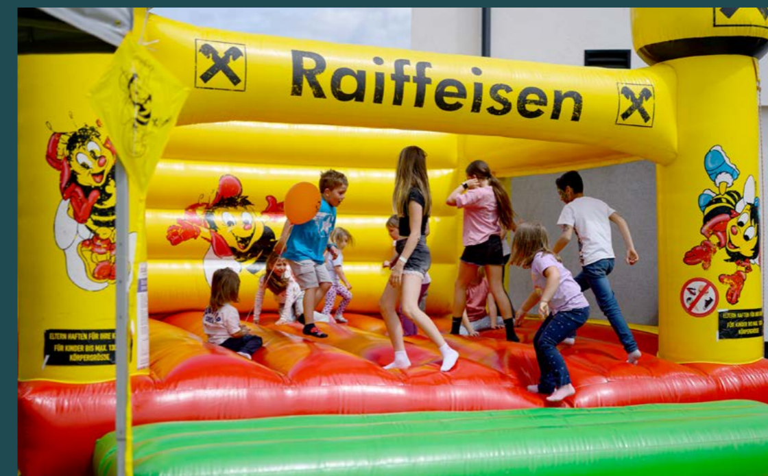
Auch das Hüpfen und Toben mit Sumsi machte Spaß.