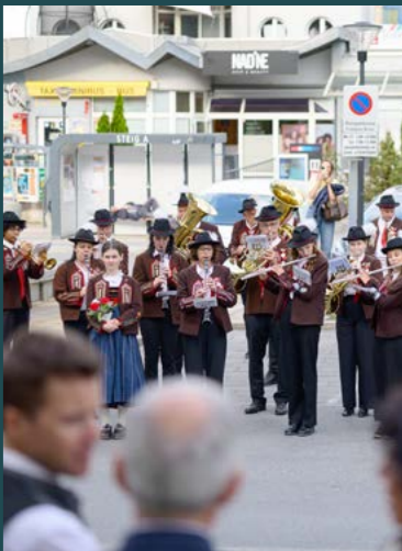
Festliche Klänge der Musikkapelle Ötztal-Bahnhof.

zu sehen und bewusst im Hier und Jetzt zu leben. Besonders spannend waren seine Gedanken zum Thema Humor am Arbeitsplatz: Wer mehr lacht, ist kreativer, motivierter und bleibt länger gesund. Der Vortrag kam bei den Gästen hervorragend an und sorgte für viele herzliche Lacher und beste Stimmung im Saal. Im Anschluss ließ man den Abend bei einem gemeinsamen Essen sowie Getränken gemütlich ausklingen. So wurde die Eröffnungsfeier zu einem gelungenen Auftakt für den neuen Zentralstandort.