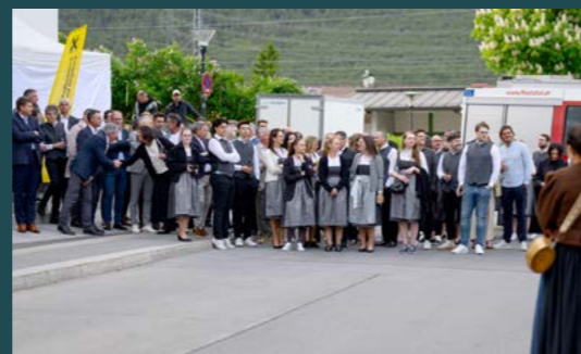
Geladene Gäste und Mitarbeitende in bester Stimmung.