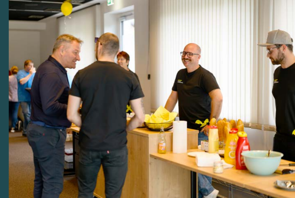
Für die Verpflegung der Gäste war bestens gesorgt.

Der Tag der offenen Tür war nicht nur eine Gelegenheit, unsere neuen Räumlichkeiten zu präsentieren, sondern vor allem ein schönes Zeichen für Gemeinschaft, Begegnung und Zusammenhalt. Die vielen positiven Rückmeldungen und die großartige Stimmung machten diesen Tag zu etwas ganz Besonderem. Wir bedanken uns herzlich bei allen Gästen für ihren Besuch und freuen uns darauf, viele Kundinnen und Kunden auch künftig in unserer neuen Bankzentrale begrüßen zu dürfen.