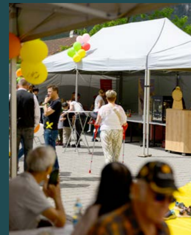
Bei prächtigem Wetter lud der Vorplatz zum Verweilen ein.