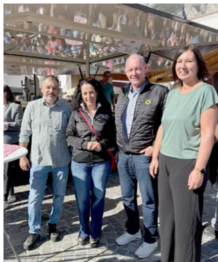
Organisatoren und Sponsoren sind sich einig: Die Tradition der Markttage hat Zukunft.

An zwei Samstagen im Oktober wird Haiming zum lebendigen Treffpunkt für tausende Besucherinnen und Besucher. Die Haiminger Markttage zeigen eindrucksvoll, wie vielfältig Direktvermarktung heute ist.