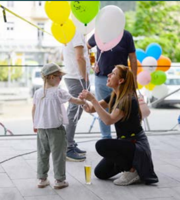
Darf's zur Begrüßung ein bunter Luftballon sein?