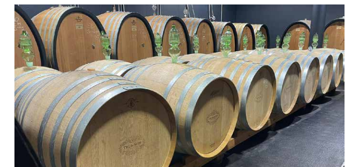
Kleiner Einblick in den neuen Weinkeller, der im Frühjahr 2025 fertiggestellt wird

Ab dem 6. März 2025 ist der Buschenschank Trummer wieder von Freitag bis Sonntag von 12-21 Uhr geöffnet.