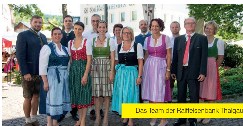
Das Team der Raiffeisenbank Thalgau.