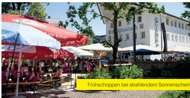
Frühschoppen bei strahlendem Sonnenschein.