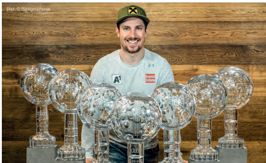
Marcel Hirscher ist siebenfacher Gesamtweltcup-Sieger. Welche Ziele er noch hat und wie sich sein Leben verändert hat, lesen Sie hier.

Sehr gut! Ich profitiere von der ausgedehnten Pause und der Ruhe. Körperlich bin ich auch in guter Verfassung – alles sehr fein gerade.