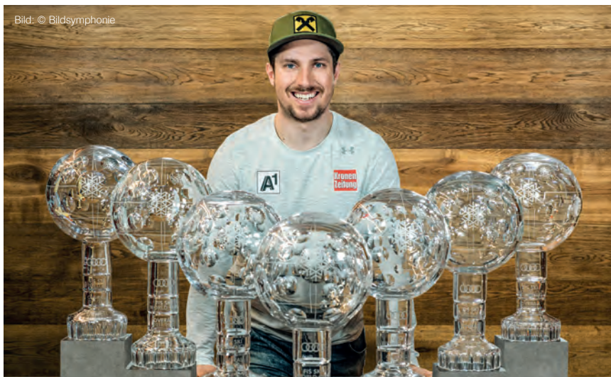
Marcel Hirscher ist siebenfacher Gesamtweltcup-Sieger. Welche Ziele er noch hat und wie sich sein Leben verändert hat, lesen Sie hier.

Sehr gut! Ich profitiere von der ausgedehnten Pause und der Ruhe. Körperlich bin ich auch in guter Verfassung – alles sehr fein gerade.