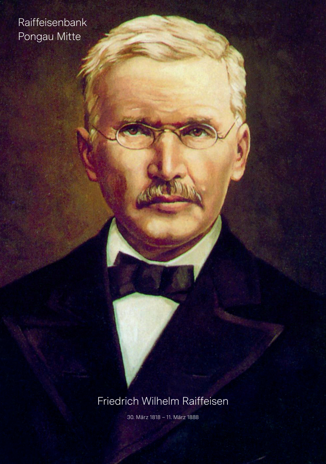
Friedrich Wilhelm Raiffeisen