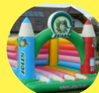
HUPFBURG FÜR DIE KINDER