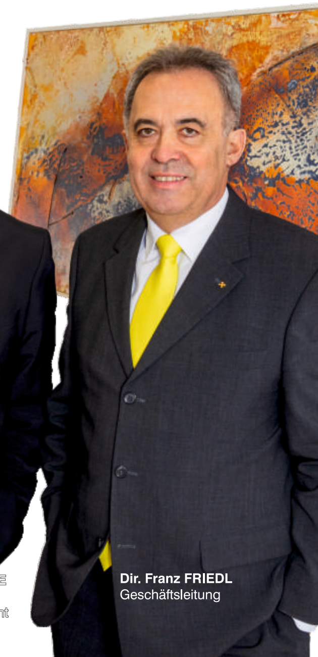
Dir. Franz FRIEDL Geschäftsführung