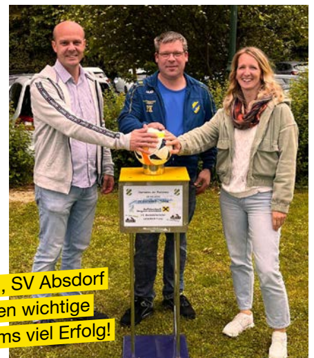
Die letzten Patronanzen wurden an die Vereine FZSV Rußbach, SV Absdorf und SV Stetteldorf übergeben. Damit erhalten die Mannschaften wichtige Unterstützung für die laufende Saison. Wir wünschen den Teams viel Erfolg!