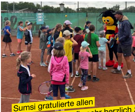
Sumsi gratulierte allen kleinen Tennisprofis sehr herzlich zu den erfolgreichen Sommer-Tenniscamps in Großweikersdorf, Hausleiten und Niederrußbach.