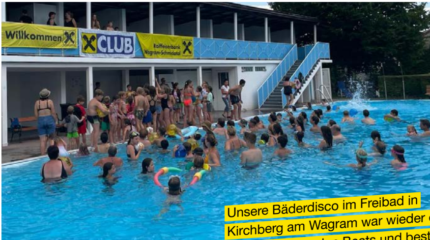
Unsere Bäderdisco im Freibad in Kirchberg am Wagram war wieder ein voller Erfolg mit Spielen, coolen Beats und bester Stimmung.