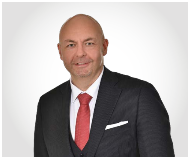
Dir. Manfred Leitner, CMC