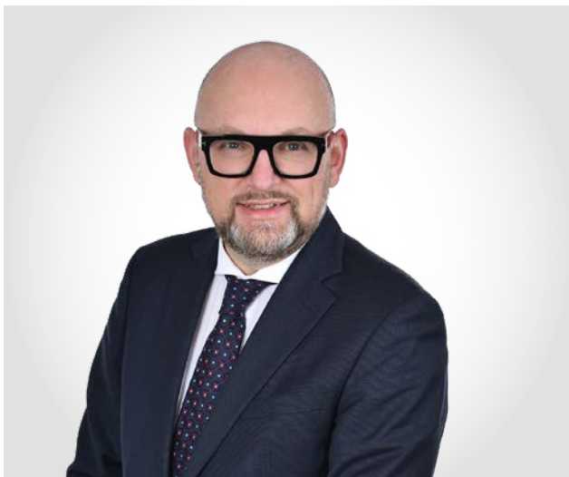
Dir. Mag. Karl Hameder, CMC