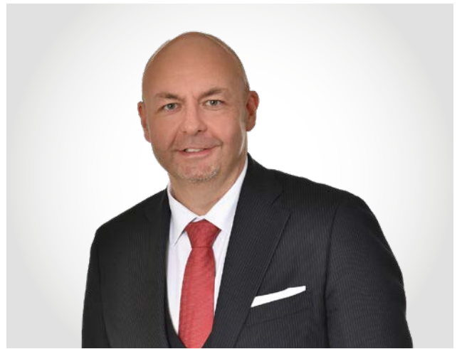
Dir. Manfred Leitner, CMC