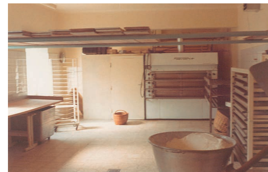
Die Bäckerei Danecker zu Gründungszeiten

Heute betreibt die Bäckerei mehrere Filialen in Amstetten, aber auch in Wallsee, Perg, St. Valentin, Linz, Kematen/Ybbs, Aschbach und Mauer. Jede davon ein Ort voller Duft, Leben und Herzlichkeit. Ob der erste Kaffee am Morgen, das knusprige Jausenweckerl zwischendurch oder der süße Klassiker zum Nachmittagskaffee – bei Danecker beginnt Genuss mit einem Lächeln hinter der Theke.