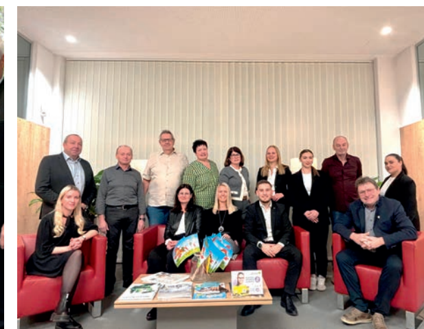
Bankstelle Weisses Kreuz Neufurth