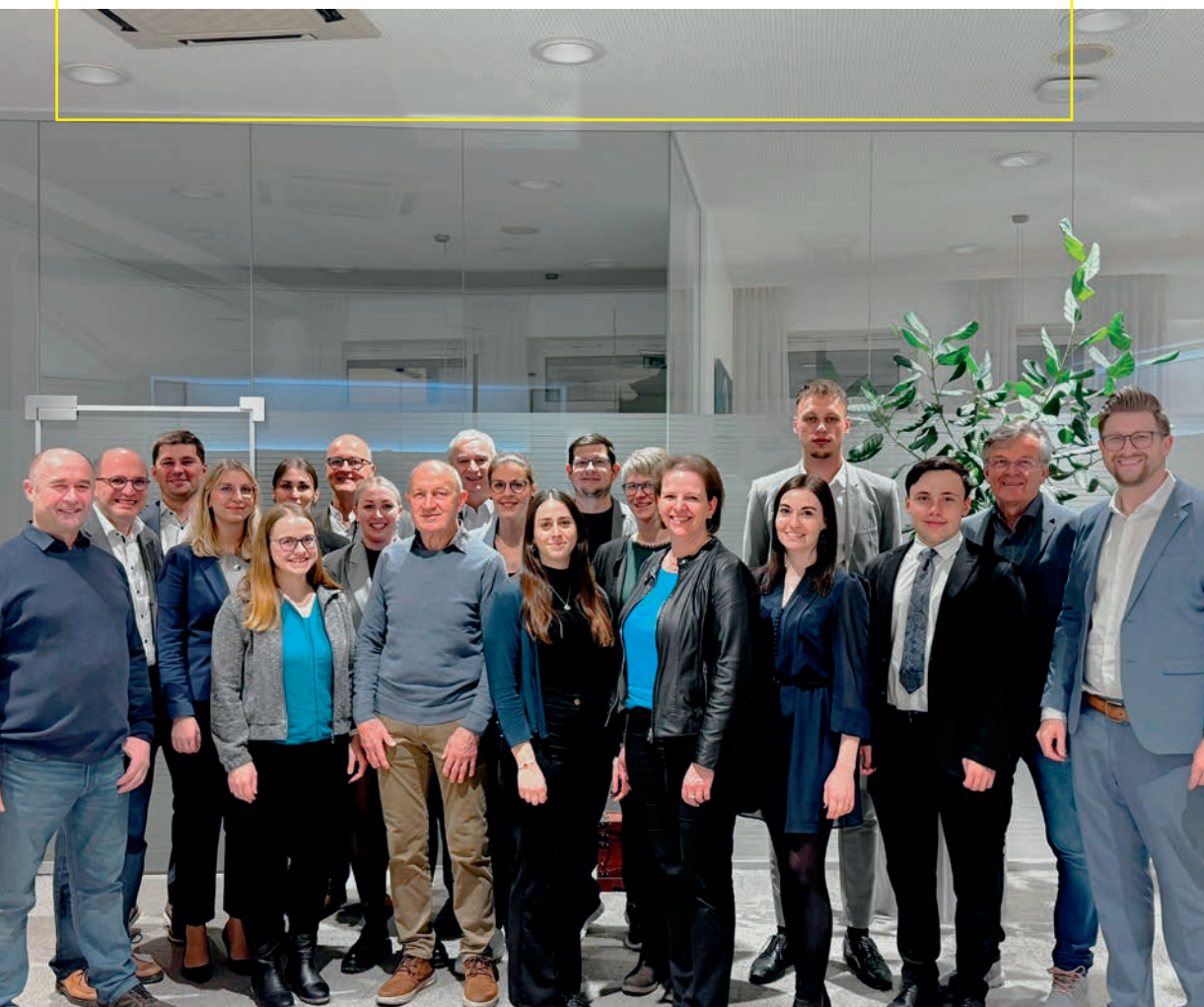
Bankstelle Hauptplatz Amstetten