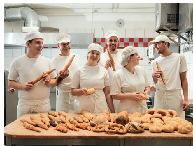
Das Bäcker-Team von Weinberger

5% Rabatt-Gutschein auf alle Backwaren und Mehlspesen in der Bäckerei Weinberger.