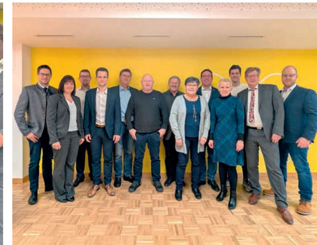
Bankstelle Raiffeisenplatz Amstetten