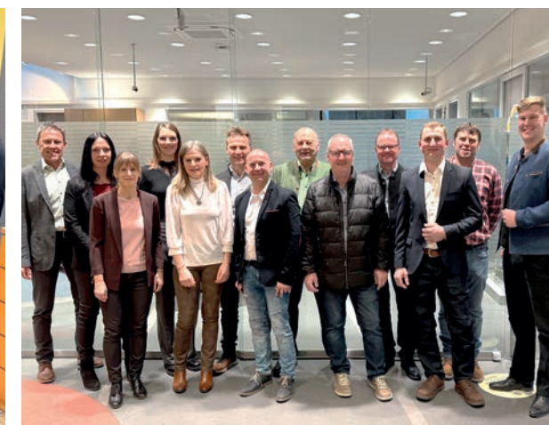
Bankstelle St. Peter in der Au