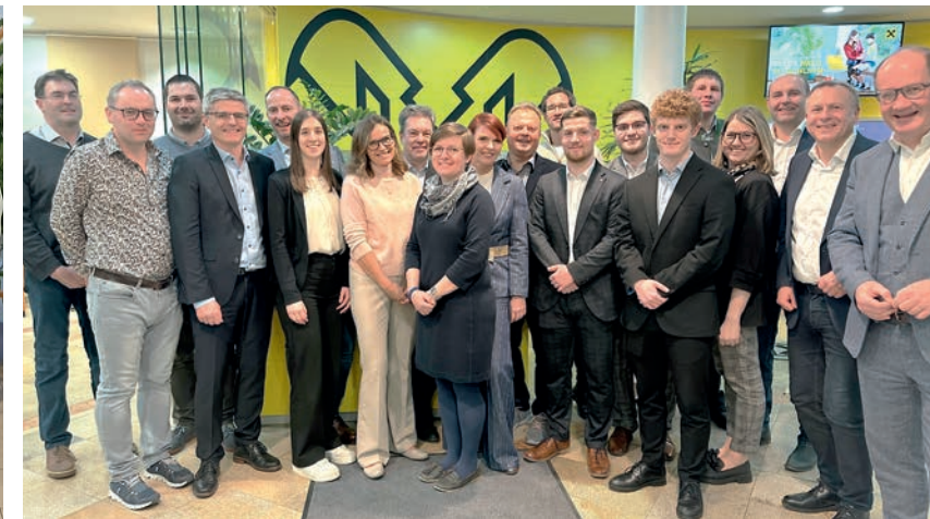
Bankstelle St. Valentin