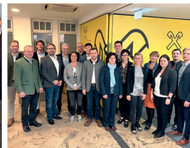
Bankstelle Ybbs an der Donau