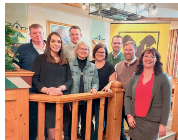
Bankstelle St. Georgen am Ybbsfelde