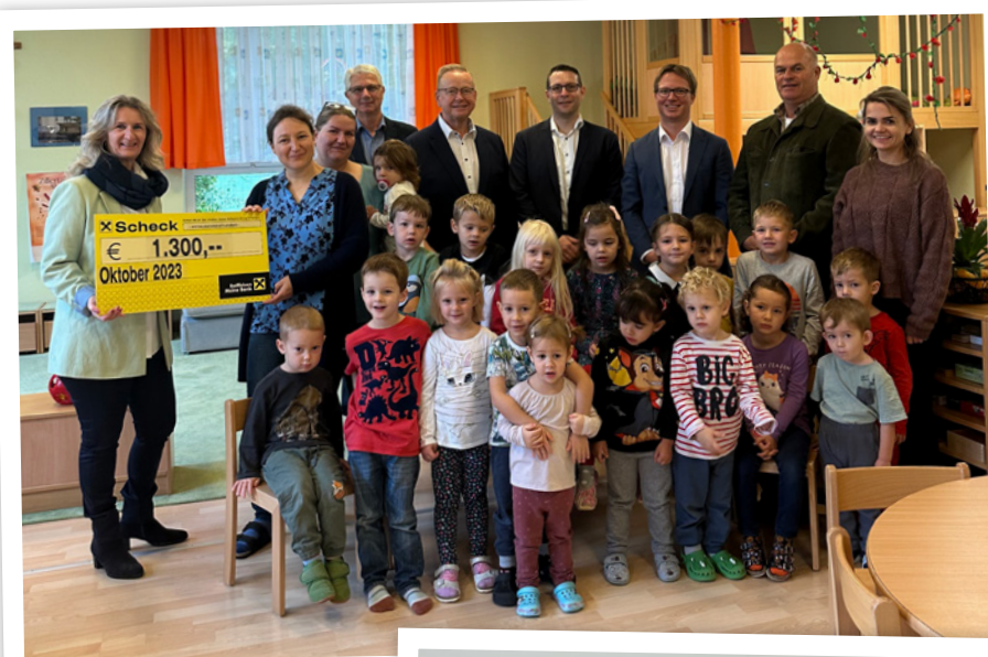
Scheck-Übergabe an den Kindergarten Eckartsau.

Anlässlich der heurigen Spartage unterstützten wir die beiden Kindergärten Eckartsau und Haringsee mit jeweils 1.300 € .