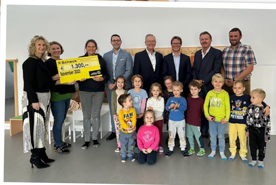
Scheck-Übergabe an den Kindergarten Haringsee.