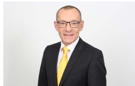
Dir. Alois Semmler