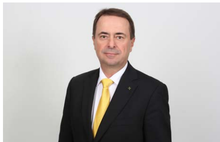
Dir. Rudolf Haberler