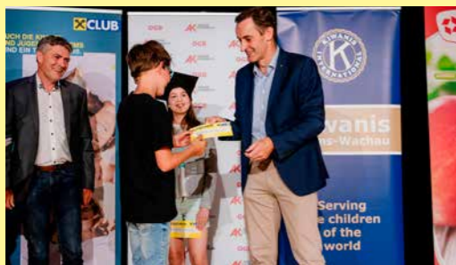
Frühstudieren erleben: Junge Uni und Fit4Youiversity . Seit 2006 öffnet die IMC FH Krets im Sommer ihre Türen für Jungstudierende. Wir unterstützen die Teilnehmer:innen mit Workshops, Vorlesungen und einer Ermäßigung fürs Mittagessen.