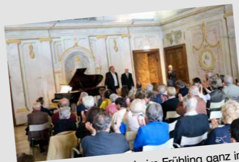
Wenn das Stift Dürnstein im Frühling ganz im Zeichen der Musik steht, wird die Schubertiade zu einem besonderen Treffpunkt für Kultur und Begegnung. Hochkarätige Konzerte, spannende Einblicke in das Werk Franz Schuberts und eine einzigartige Atmosphäre machen diese Tage zu einem Fixpunkt in der Region. Wir freuen uns, diese besondere Veranstaltungsreihe als Partner zu begleiten.