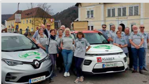
Partnerschaft lebt vom Miteinander. Deshalb war es für uns von Beginn an selbstverständlich, den Fahrdienst Paudorf Mobil zu unterstützen. Auch nach der Schließung unserer Bankstelle in Paudorf können unsere Kund:innen dank Paudorf Mobil ihre Bankgeschäfte nun bequem in Furth erledigen.