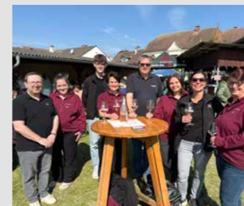
50 Jahre die Bäuerinnen : Seit jeher tragen die Bäuerinnen entscheidend zum Gelingen landwirtschaftlicher Betriebe bei. Ob auf Märkten, bei Aktionstagen in Volksschulen oder anderen Projekten – ihr Wissen und ihre Produkte erreichen die Menschen weit über den Hof hinaus. Wir unterstützen diese wertvolle Arbeit gerne!