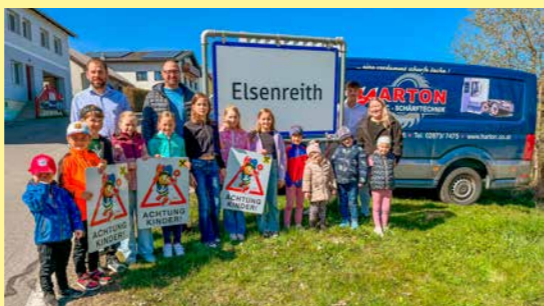
Sicher unterwegs mit Sumsi : Unzählige Kinder wurden bereits auf ihrem Weg in Kindergarten und Schule von Sumsi und den „Achtung Kinder“-Tafeln begleitet. Wir unterstützen außerdem regelmäßig freiwillige Fahrradprüfungen in den Volksschulen und stellen Warnwesten für einen sicheren Schulweg bereit.