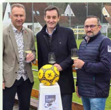
Seit 1950 steht der SV Rehberg für gelebten Sport und Gemeinschaft. Seit Jahrzehnten begleiten wir den Verein als Sponsorpartner – am Spielfeld ebenso wie bei besonderen Momenten abseits davon.