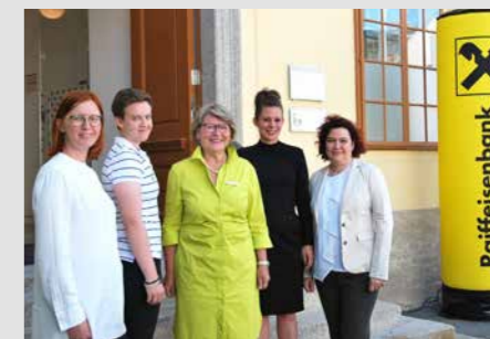
Soroptimist International ist ein weltweites Netzwerk engagierter Frauen, das sich für die Verbesserung der Lebensbedingungen von Frauen und Mädchen einsetzt. Mit Initiativen rund um Awareness, Advocacy und Action entstehen wertvolle Impulse für gesellschaftlichen Wandel. Wir unterstützen in Krets die traditionelle Weintaufe „Wein.Weib.Gesang“ und durften die Soroptimistinnen auch bereits bei unseren Kundenveranstaltungen auf der Bühne begrüßen.