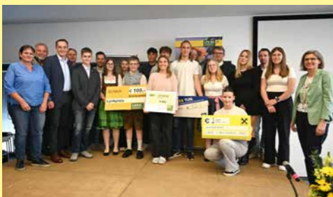
Schulpartnerschaften sind uns ein Anliegen. Seit Jahren arbeiten wir eng mit der Landwirtschaftlichen Fachschule Krets zusammen – von Unterrichtsunterstützung durch Schulvorträge bis zu gemeinsamen Veranstaltungen für unsere Kund:innen entstehen immer wieder neue Ideen und Impulse.