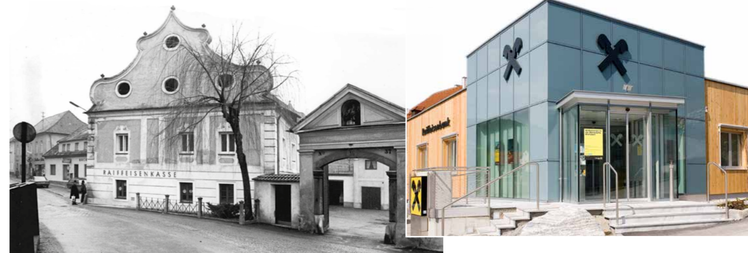
1886 – Erste Raiffeisenkasse in Österreich: Mühldorf früher und heute