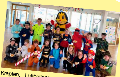
Krapfen, Luftballons und jede Menge gute Laune – so feiern die Kinder in unserer Region Fasching. Wir sind stolz, Schulen und Elternvereine dabei als Partner zu unterstützen und dazu beizutragen, dass Traditionen lebendig bleiben und die Kinder Momente erleben, die in Erinnerung bleiben.