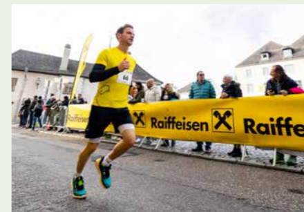
Den Raiffeisen-Silvesterlauf des Triathlonvereins Krets unterstützen wir schon so lange, dass viele denken, wir wären die Veranstalter – kein Wunder bei Start, Ziel und komplett gelb markierter Strecke vor unserer Haustür. Danke für die jahrzehntelange Partnerschaft!