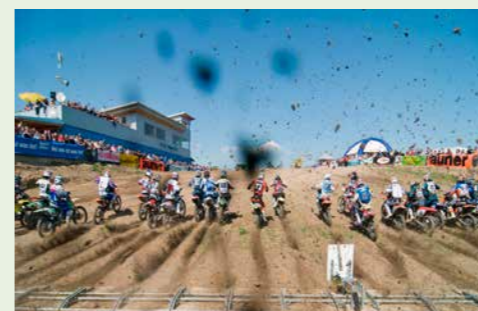
Seit 1973 prägt der MSC Imbach den Motocross-Sport in Niederösterreich. Wir freuen uns, den Verein bei seinen Veranstaltungen am Pfenningberg zu unterstützen und gemeinsam den Motorsport vor Ort erlebbar zu machen.