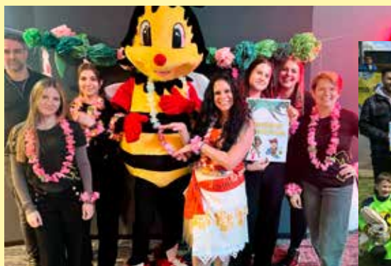
Beim Raiffeisen Club Kino sorgten Sumsi und Vaiana für Sommer-Gefühle an einem grauen Herbstnachmittag.