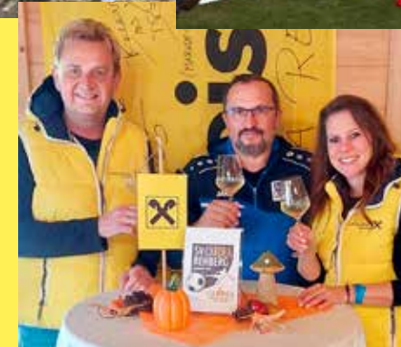
Der SV Rehberg zählt zu unseren langjährigsten Partnern im Sportsponsoring. Wir sind immer wieder gerne bei Matches und Events dabei – so wie hier im Raika-VIP-Stadl nach einem erfolgreichen Spiel.