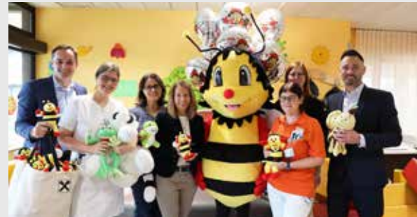
Mit Herz und Engagement dabei! Unser Team sammelte Stofftiere für die Kinderstation im Universitätsklinikum Krems und überreichte sie gemeinsam mit Sumsi zum Weltspartag – für strahlende Kinderaugen.