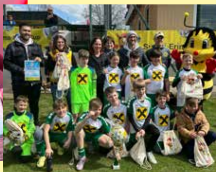
Der Sumsi Erima Fußballcup für Volksschulen ist ein Highlight in unserem Veranstaltungskalender! Hier ein Moment vom spannenden Finale der Volksschulen Krems/Stadt auf dem Sportplatz in Stein.