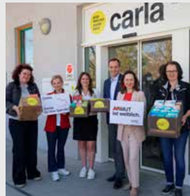
Im Rahmen unserer CSR-Aktivitäten unterstützen wir die Caritas: Zum Weltfrauentag haben unsere Mitarbeiter:innen Hygieneartikel für Frauen in Not gesammelt und persönlich übergeben.