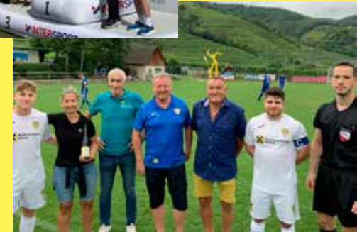
Mit dem USC Weißenkirchen verbindet uns eine besondere Partnerschaft – wir sind als Sponsor, Funktionär und sogar auf dem Spielfeld vertreten. Wenn Engagement, dann mit vollem Einsatz! Mehr WIR geht nicht.