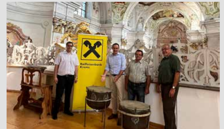
Mit unserer Unterstützung erstrahlen die barocken Pauken der Pfarre Maria Langegg aus dem 18. Jahrhundert in neuem Glanz. Wir freuen uns auf viele beeindruckende Konzerte mit den restaurierten Instrumenten!