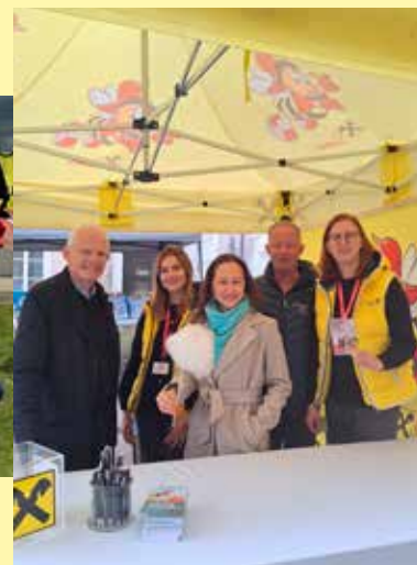
Zum Nationalfeiertag wird die Kunstmeile jedes Jahr zum großen Familienfest – mit spannenden Erlebnissen in Museen, auf den Straßen und Plätzen. 2024 waren wir erstmals Partner vom Kinderkunstfest .