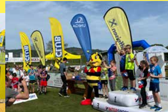
Seit Beginn unterstützen wir den Donaulauf des USV Furth – ein sportliches Frühjahrs-Highlight. Besonders freut sich Sumsi jedes Jahr auf die Kinderläufe und den Human Bridge Inklusionslauf.