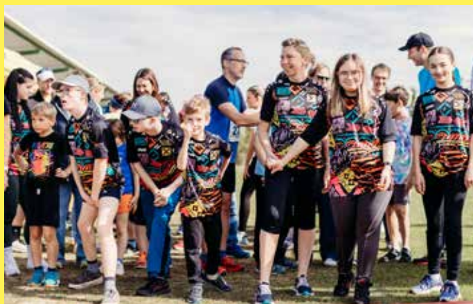
Seit Jahren sind wir Partner des USV Furth , der den Donaulauf veranstaltet. Außerdem arbeiten wir mit Human Bridge zusammen und konnten heuer gemeinsam den ersten Inklusionslauf auf die Beine stellen.