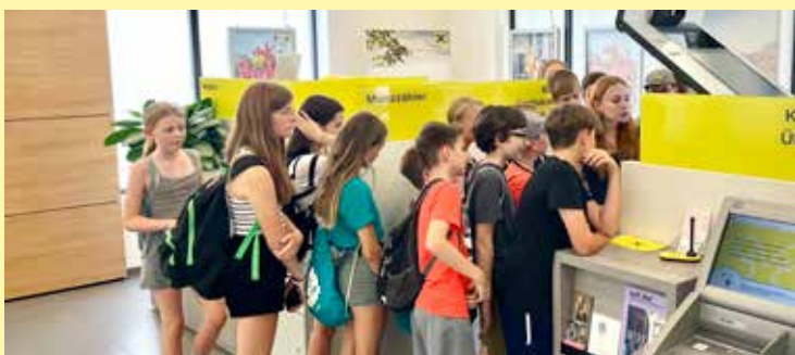
Seit Beginn dürfen wir Partner der Jungen Uni der IMC FH Krems sein – jedes Jahr ein tolles Erlebnis, Vorlesungen und Workshops für die Student:innen gestalten zu dürfen.