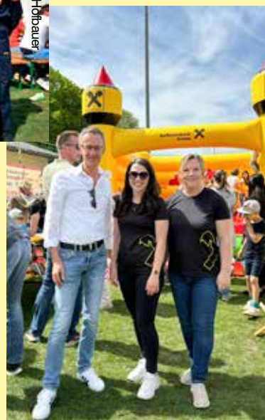
Mit Sumsi und unserer Luftburg sind wir das ganze Jahr über in der Region unterwegs. Sie wollen die Luftburg für Ihren Verein ausleihen? Melden Sie sich bei uns!