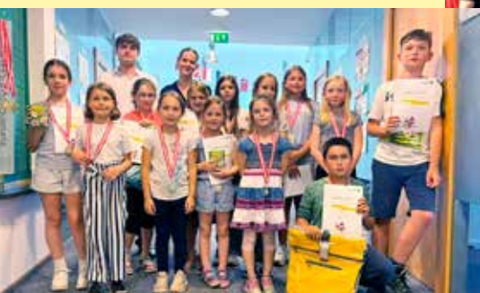
Übers Jahr führen wir verschiedenste Aktivitäten mit unseren Partnerschulen durch. Ein Schnappschuss von der Preisverleihung des Raiffeisen Jugend(mal)wettbewerbs in der Bankstelle Mautern.