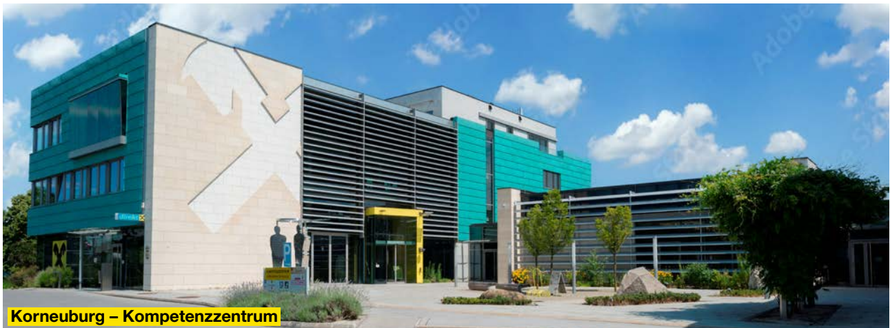
Korneuburg – Kompetenzzentrum

Technik mit persönlicher Betreuung. Besonders wichtig ist uns die persönliche Beratung . Denn Finanzentscheidungen sind Vertrauenssache. Unsere Mitarbeiter nehmen sich Zeit für Ihre Fragen und entwickeln gemeinsam mit Ihnen Lösungen, die langfristig Sicherheit und Mehrwert schaffen. Wir vereinen Regionalität, digitale Kompetenz und persönliche Betreuung.