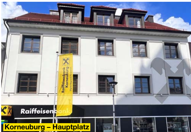
Korneuburg – Hauptplatz