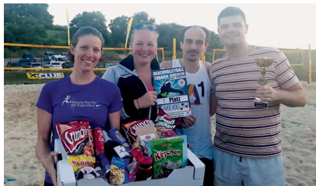
So sehen Sieger aus! Das Team „Avocado“ war der Sieger beim diesjährigen Beachvolleyballturnier in Gaweinstal und durfte sich über eine Geschenkbox der Bankstelle Gaweinstal freuen.