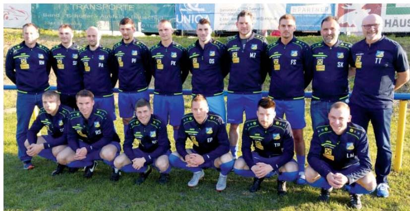
Die Bankstelle Spannberg leistete einen finanziellen Beitrag beim Ankauf neuer Trainingsjacken des SK Spannberg.