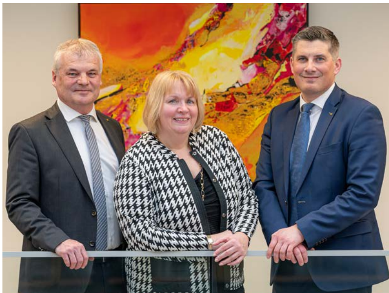
DIE GESCHÄFTSLEITUNG DER RAIFFEISENBANK HOLLABRUNN

Denn Zukunft entsteht dort, wo Erfahrung auf neue Ideen trifft – und wo Menschen miteinander an einem erfolgreichen Morgen arbeiten.