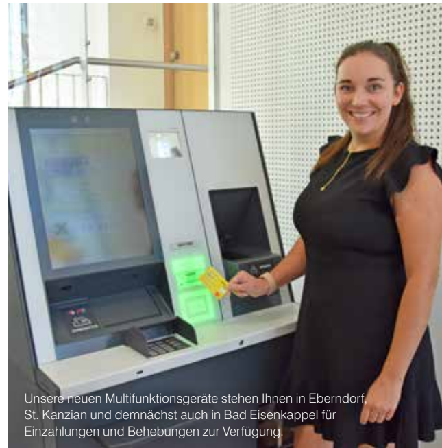
Unsere neuen Multifunktionsgeräte stehen Ihnen in Eberndorf, St. Kanzian und demnächst auch in Bad Eisenkappel für Einzahlungen und Behebungen zur Verfügung.