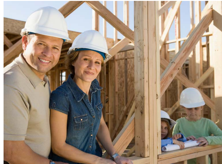
Steigende Zinsen, schwankende Immobilienpreise und höhere Baukosten werfen bei Bauinteressierten nach wie vor viele Fragen auf.

Die Preise haben sich vielerorts beruhigt – vor