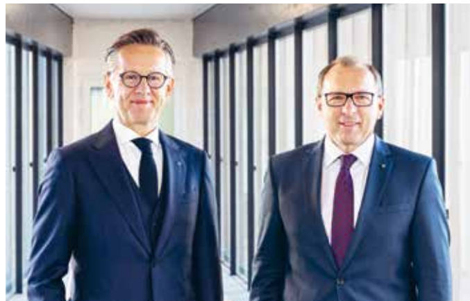
Dir. Klaus Ahammer MBA