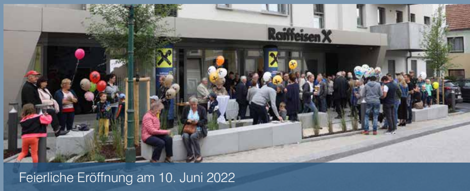
Feierliche Eröffnung am 10. Juni 2022