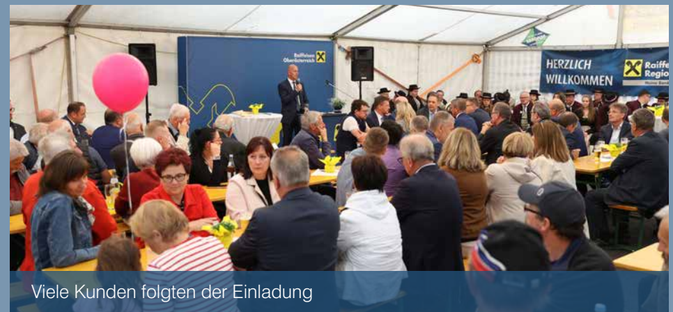
Viele Kunden folgten der Einladung