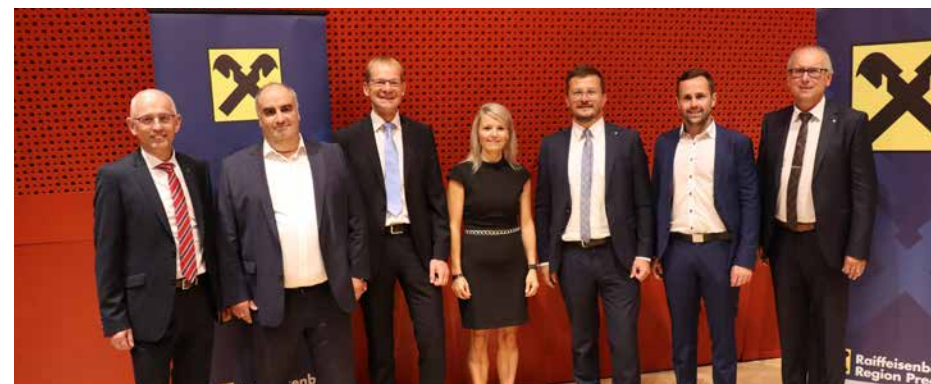
Die Raiffeisenbank Aist - in Kooperation mit Raiffeisen RESEARCH, KEPLER KAG und der Raiffeisen CENTROBANK - ist der Partner für nachhaltiges Anlegen.

Knapp 200 interessierte Kunden durfte die Raiffeisenbank am 7. September 2022 in der Bruckmühle begrüßen. Hochrangige Experten von Raiffeisen RESEARCH, Raiffeisen CENTROBANK und KEPLER-FONDS KAG präsentierten Einschätzungen zur weiteren Zinsentwicklung und Einblicke in nachhaltige Veranlagungen.