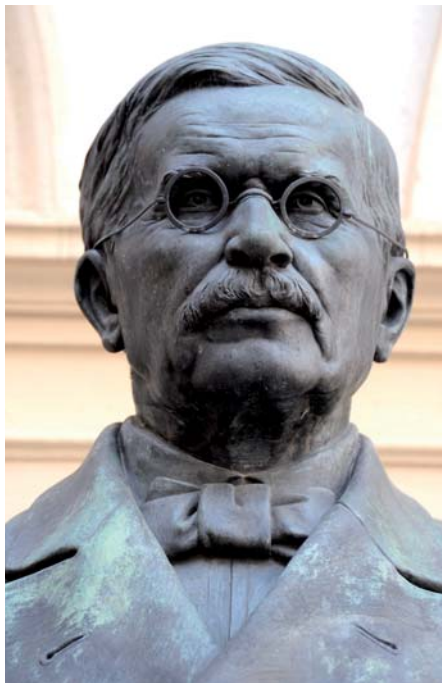
Büste NÖ Landhaus Herrengasse

1866 veröffentlicht Raiffeisen schließlich sein Buch „Die Darlehnskassenvereine als Mittel zur Abhülfe der Noth der ländlichen Bevölkerung sowie auch der städtischen Handwerker und Arbeiter“ – und das Werk wird zum Erfolg. Innerhalb weniger Jahre verbreitet sich die Genossenschaftsidee seiner Prägung zuerst