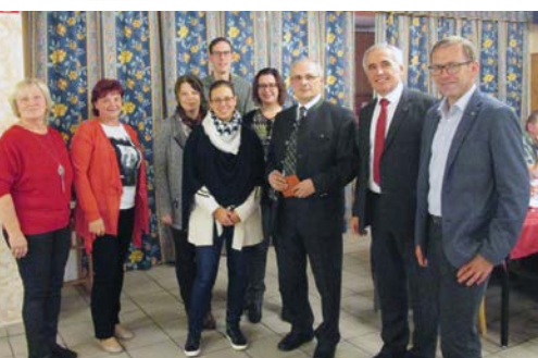
Geschäftsleiter und Angestellte der Raiffeisenbank Seefeld-Hadres