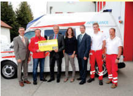
Wir unterstützen das Rote Kreuz - Bezirksstelle Allentsteig bei der Anschaffung eines neuen Rettungstransportfahrzeuges.