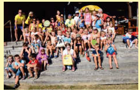
Viele Besucher gab es auch heuer wieder beim Ferienspiel in Schwarzenau.