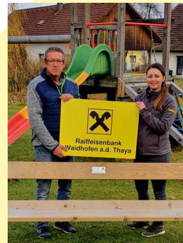
Die Bankstelle Kautzen unterstützte den DEV Engelbrechts beim Ankauf von Material f. d. Sanierung.