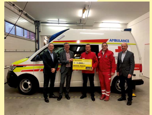
Wir haben dieses Jahr auf die Weihnachtsgeschenke verzichtet und den Betrag dem Sozialfonds "Mit.Einander helfen" zugeschrieben. Dieses Geld wurde dem RK Allentsteig gespendet.