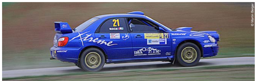
Ein 90er-Jahre Rallyeauto lässt die Herzen von Motorsport-Fans höherschlagen.

Bei der detaillierten Ausgestaltung des Leasingvertrages werden ganz individuelle Lösungen gesucht, bei denen sich die monatliche Rate durch eine optimale Gestaltung von Anzahlung, Laufzeit und Restwert perfekt an das Budget des Kunden anpasst. Ausstieg, Umstieg und Verlängerung sind jederzeit möglich. ■