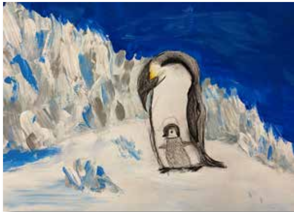
Altersgruppe 2: Amina Drabeck