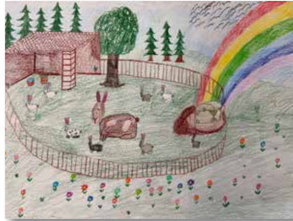
Altersgruppe 1: Lea Karlhuber