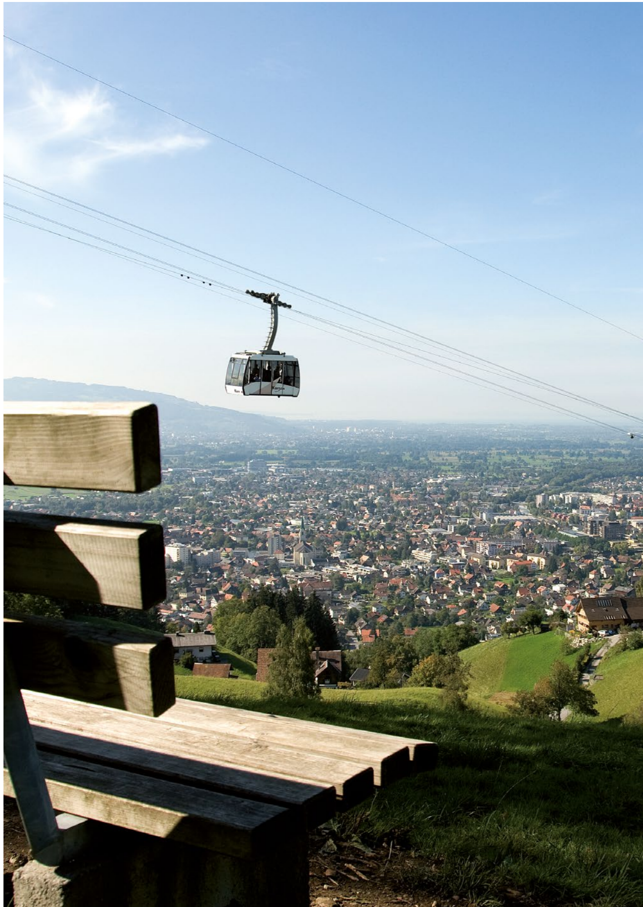
AUSBLICK VOM KARREN ÜBER DAS RHEINTAL