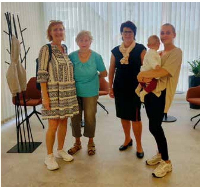
Interessierte Besucher:innen am Tag der offenen Tür