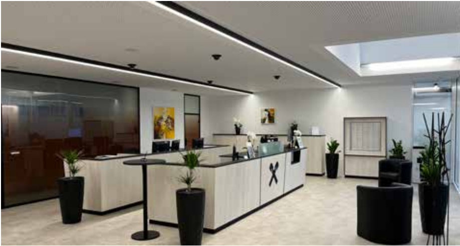
Welcome-Desk und Schalterbereich