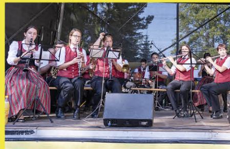
Musikalische Umrahmung durch den Musikverein Sieghartskirchen