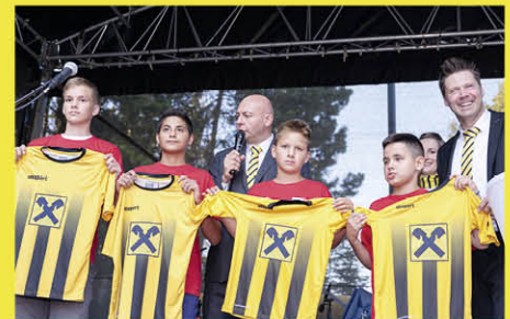
Die Nachwuchskicker des SV Sieghartskirchen