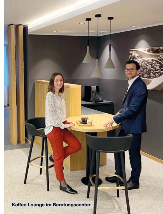
Kaffee Lounge im Beratungscenter

Die Kunden erwartet ein großzügig gestalteter Eingangs- und Wartebereich mit gemütlichen Stühlen und einem großen Informationsbildschirm. An der Kaffee Lounge kann man sich anschließend auf den Beratungstermin einstimmen. Vier individuell gestaltete und eingerichtete Beratungsräume garantieren Wohlfühl-atmosphäre und die nötige diskrete Gesprächsumgebung. Auf großen Bildschirmen