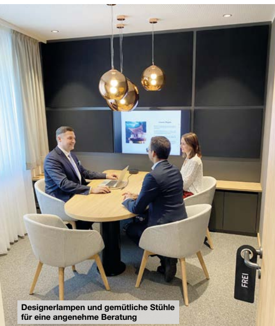
Designerlampen und gemütliche Stühle für eine angenehme Beratung

neue Kompetenzzentrum, neben dem Haupteingang durch die Bank, auch direkt über den Seiteneingang in der Kirchengasse erreichen. Der Aufzug im Stiegenhaus wird aktuell ebenfalls erneuert und auf den neuesten Stand der Technik gebracht. Neben der Realisierung des Beratungscenters werden auch im Privatkundenbereich im Erdgeschoss seit Juni einige