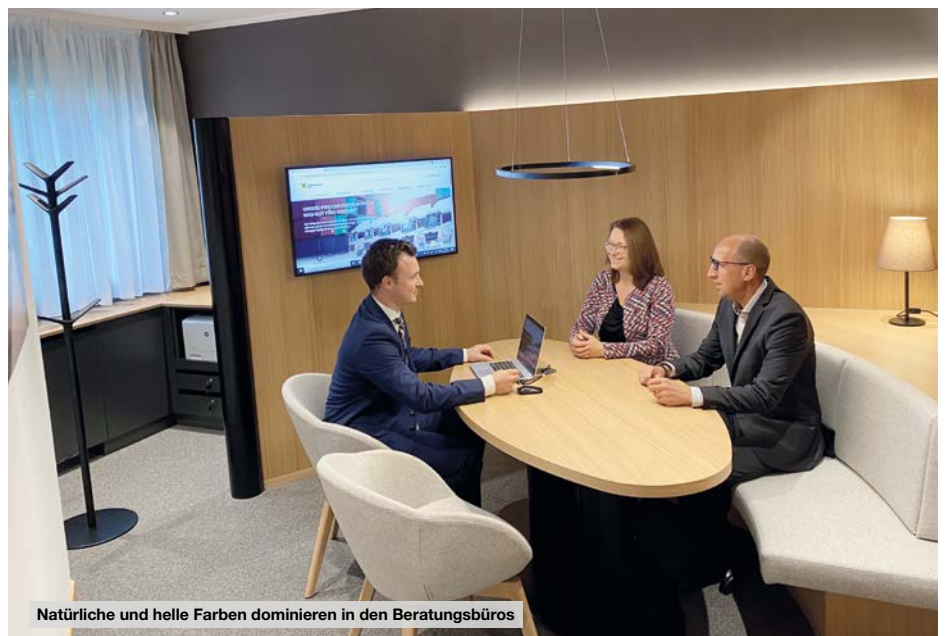
Natürliche und helle Farben dominieren in den Beratungsbüros