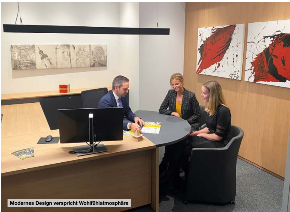
Modernes Design verspricht Wohlfühlatmosphäre

„Es ist gelungen, dieses Projekt mit Unternehmen aus der Region zeitgerecht und erfolgreich umzusetzen. Im neuen Kompetenzzentrum können wir unsere Firmenkunden und Private Banking Kunden in adäquater Umgebung in gewohnter Professionalität betreuen. Im Erdgeschoss empfangen wir unsere zahlreichen Kundinnen und Kunden in einer zeitgemäßen und modernen Anlaufstelle für ihre finanziellen Anliegen. Für uns ist dieser Umbau ein wichtiger Schritt in die Zukunft.“