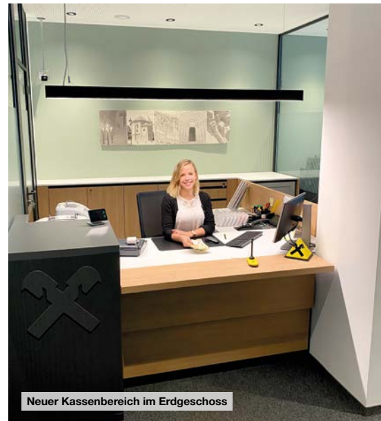
Neuer Kassenbereich im Erdgeschoss